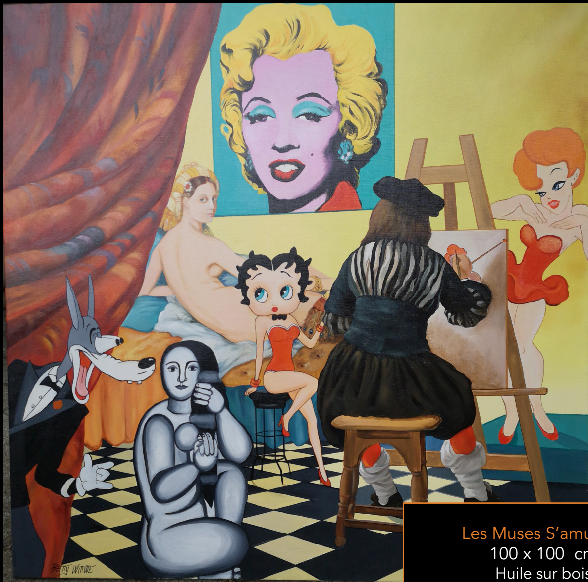
Les Muses S'amusent 100 x 100 cm Huile sur bois