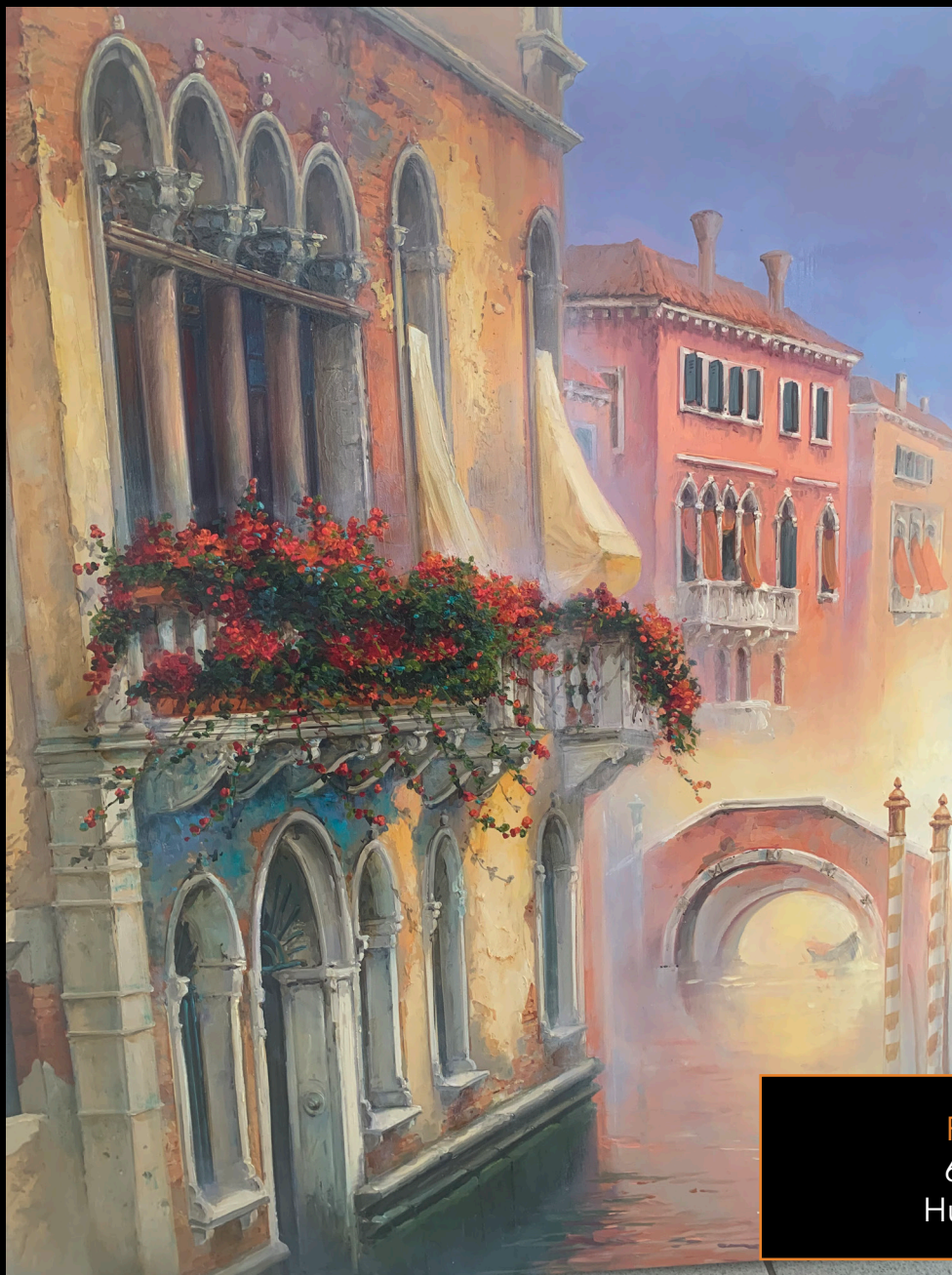
Rio Verona 65 x 54 cm Huile sur toile