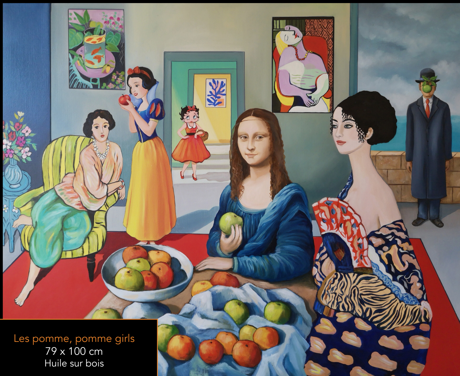
Les pomme, pomme girls 79 x 100 cm Huile sur bois