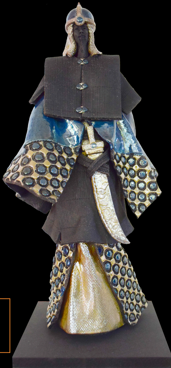
Garde de l'Empereur 53 x 25 x 25 cm Raku