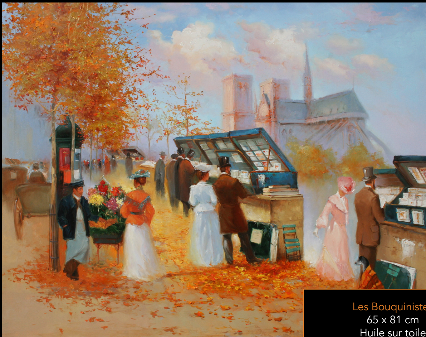
Les Bouquinistes 65 x 81 cm Huile sur toile