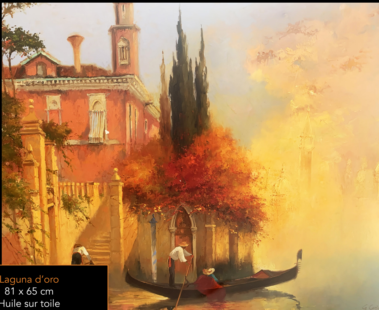
Laguna d'oro 81 x 65 cm Huile sur toile