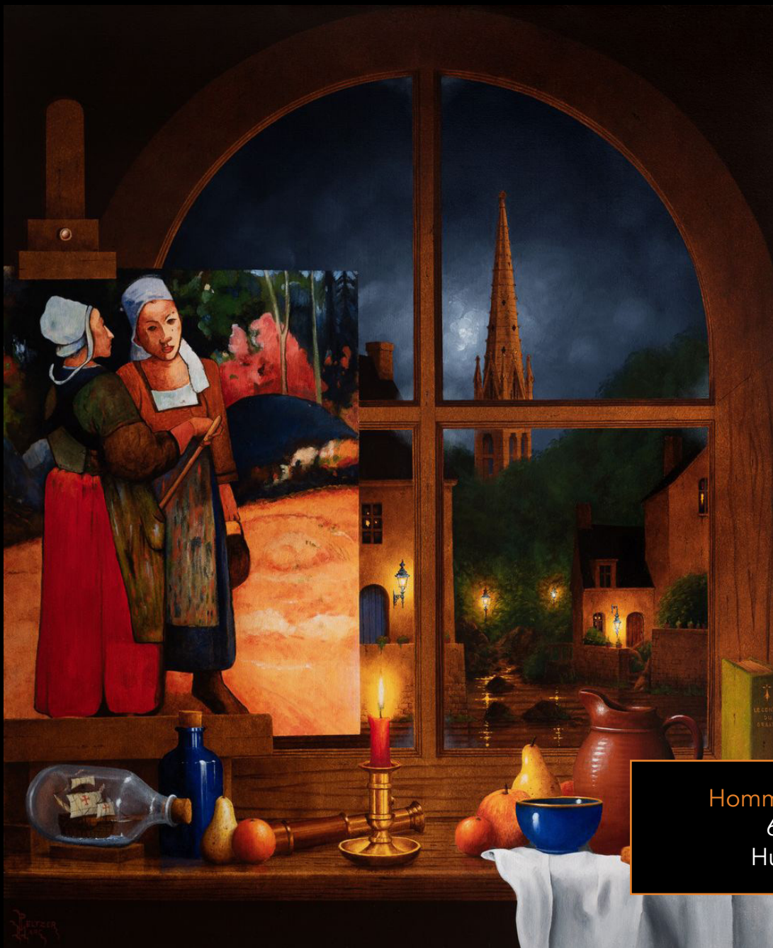
Hommage à Gauguin 60 x 73 cm Huile sur toile