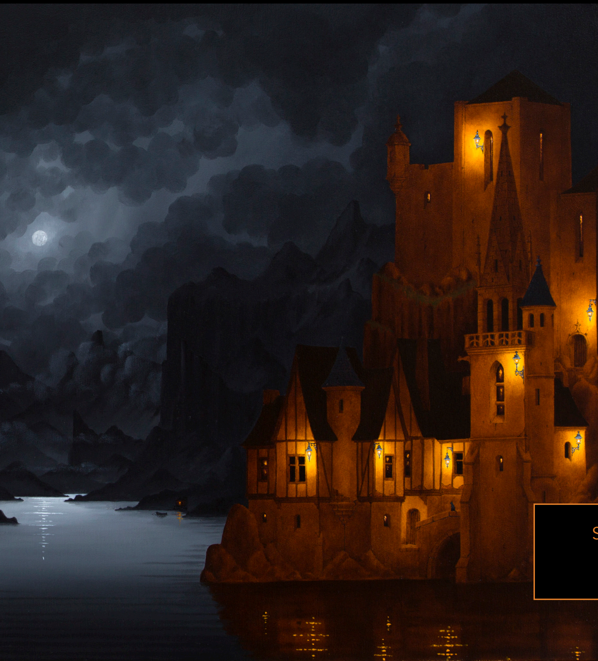
Stratford-upon-Aven 60 x 120 cm Huile sur toile