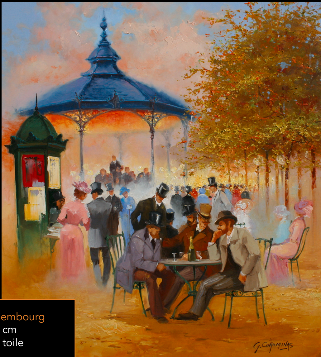
Jardin du Luxembourg 55 x 46 cm Huile sur toile