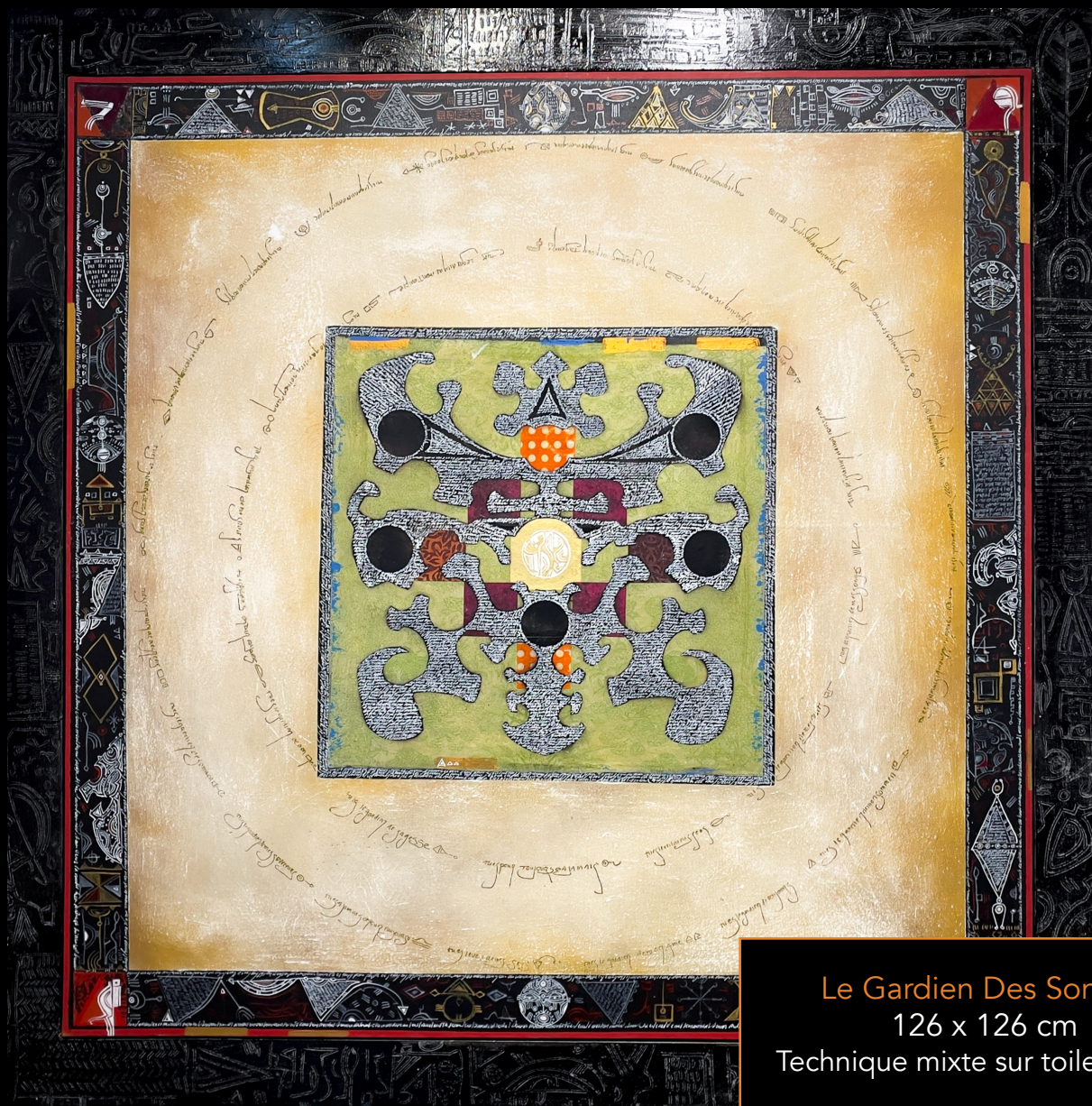
Le Gardien Des Songes 126 x 126 cm Technique mixte sur toile et bois