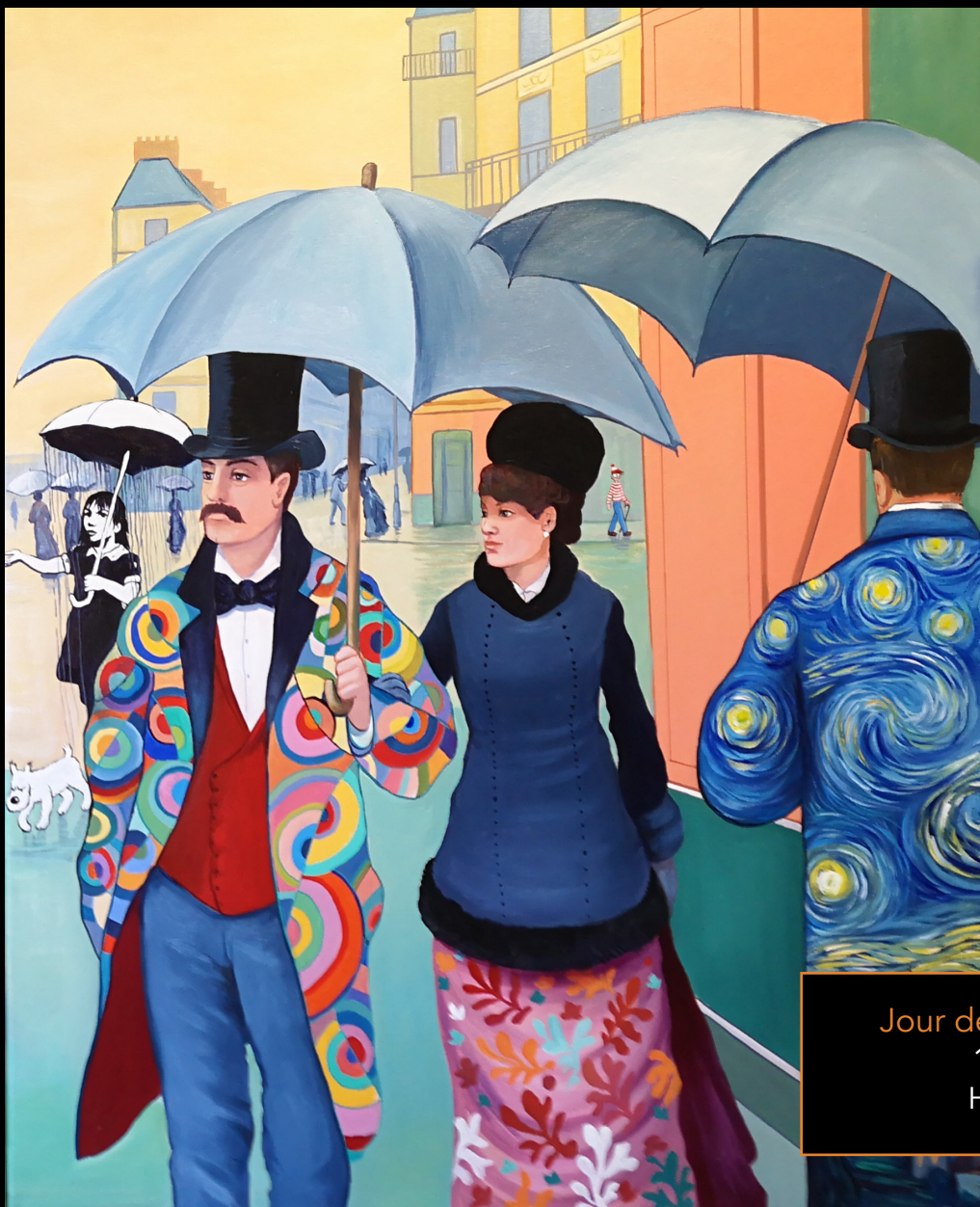
Jour de pluie (dyptique) 100 x 80 cm Huile sur toile