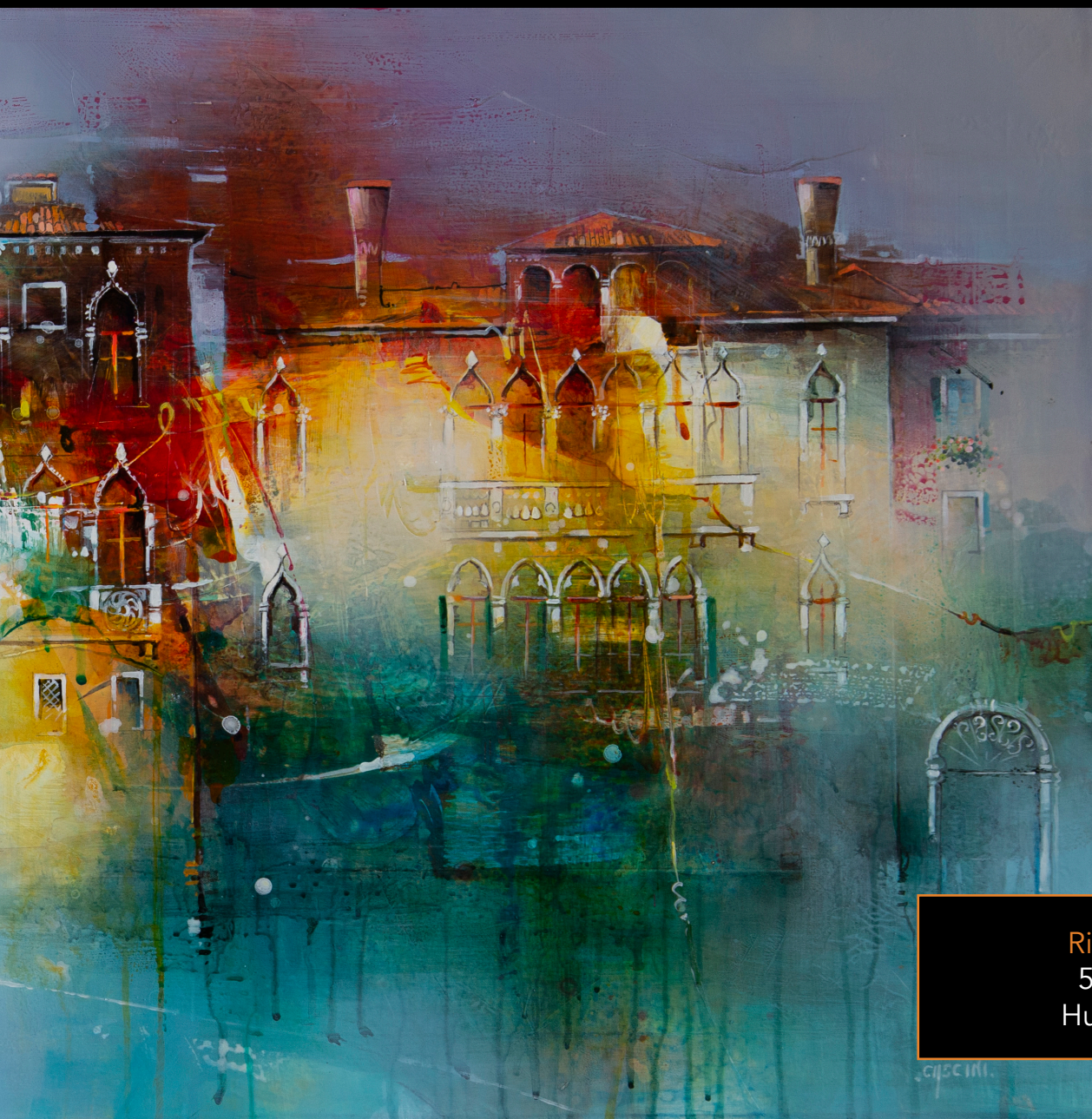
Ritratto Di V... 50 x 100 cm Huile sur toiles