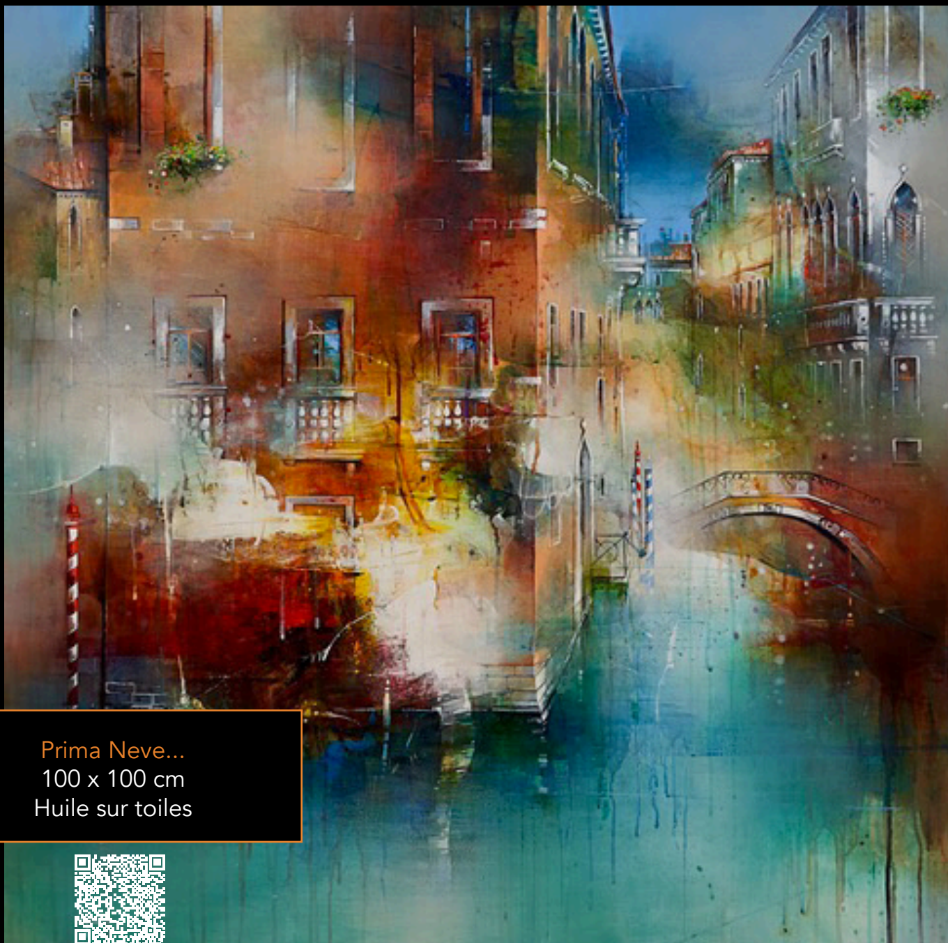
Prima Neve... 100 x 100 cm Huile sur toiles