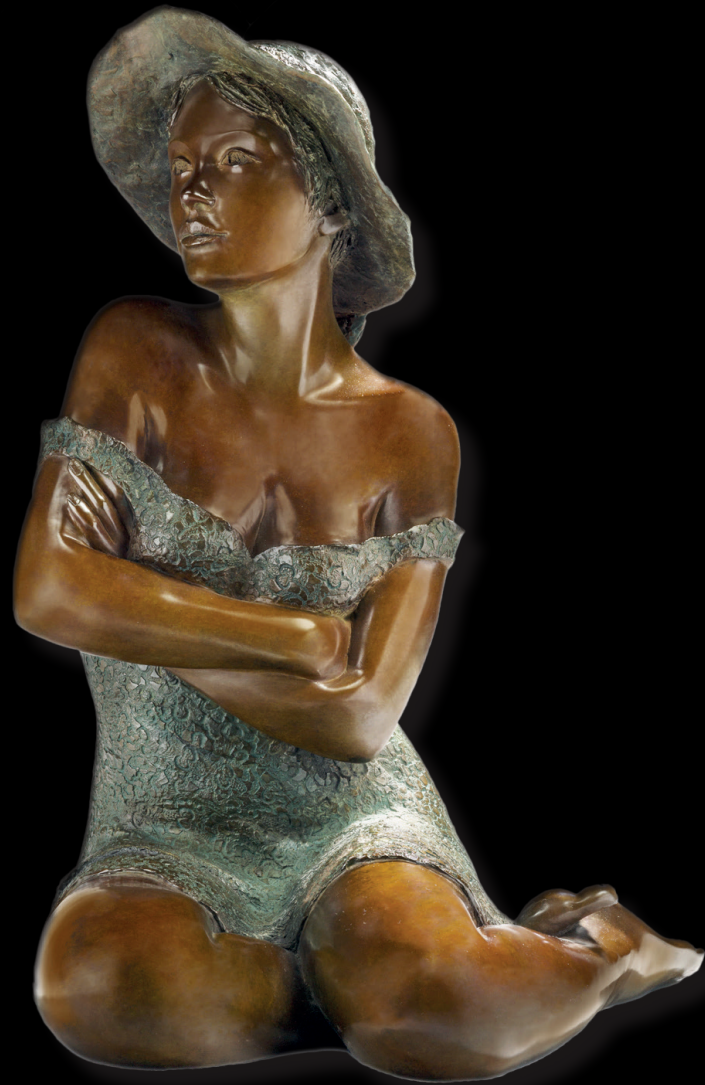
Lola 60 x 40 x 45 cm Bronze Original