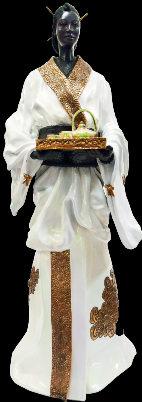
L'Heure Du Thé 92 x 30 x 30 cm Bronze Original