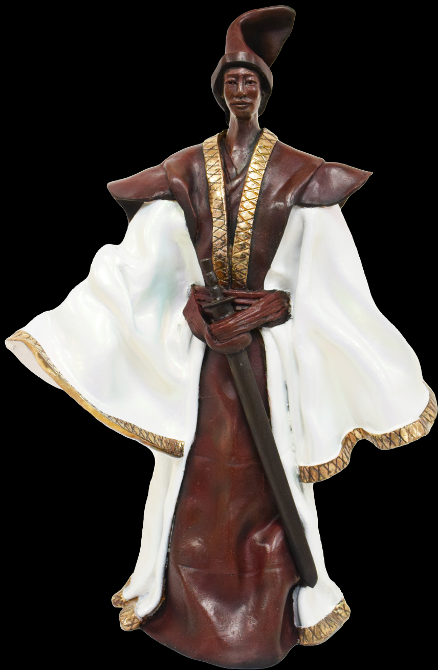
Hideyoshi H 45 cm Bronze Original