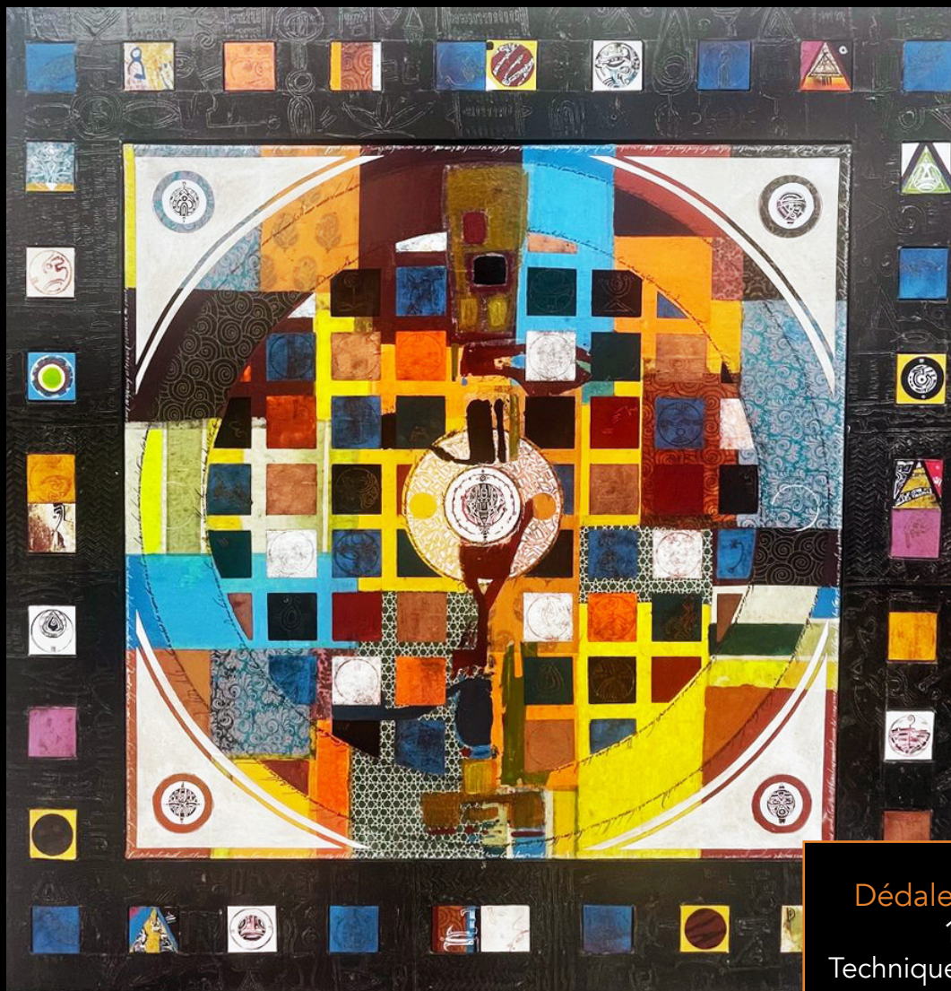
Dédale De Mes Pensées... 120 x 120 cm Technique mixte sur toile et bois