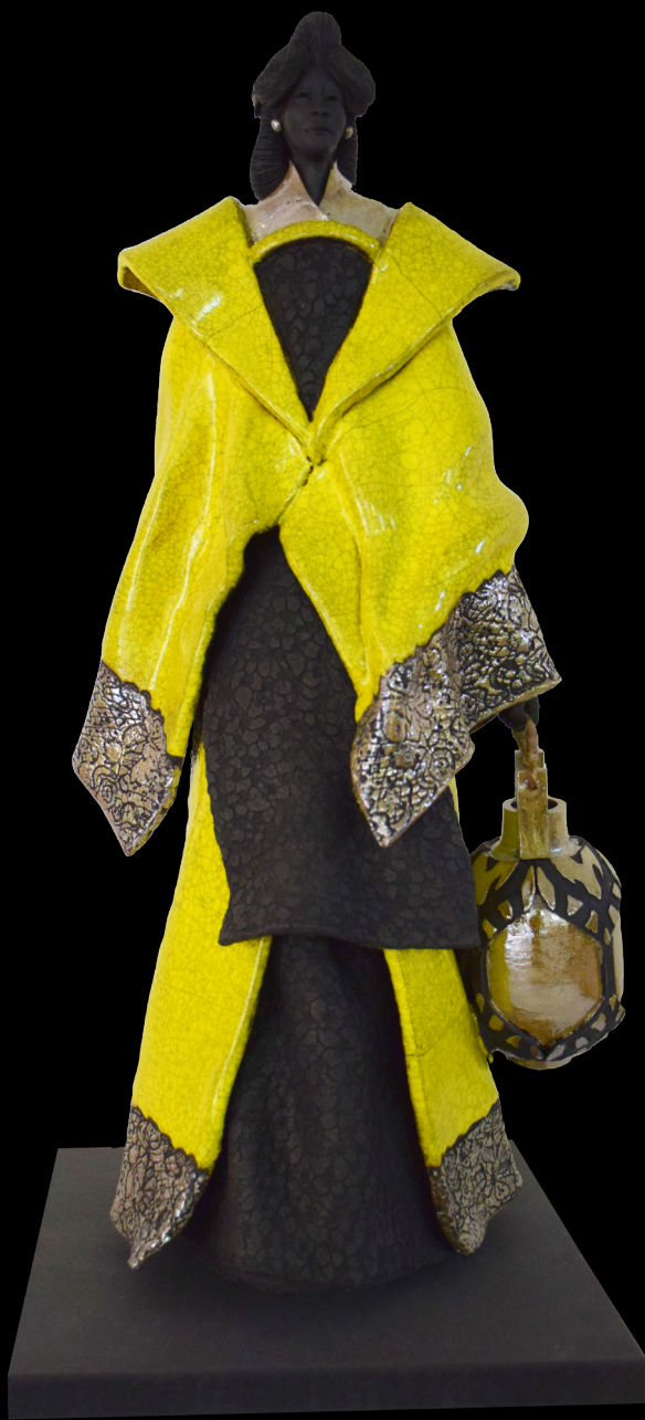
Le Marché Au Tapis 53 x 25 x 25 cm Raku